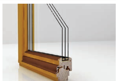
U okna nawet do 0,8 W/m²K

Produkt idealny dla klientów ceniących naturalne piękno drewna i energooszczędne rozwiązania, przywiązujących najwyższą wagę do estetyki i wygody.